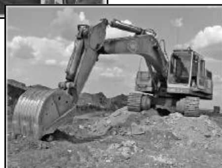
В. ЩЕРБАКОВ. На снимках некоторые моменты строительства дороги.

пособным коллективом Александр Горбунов. В сутки на АБЦ производится до 400 тонн первоклассного асфальтобетона.