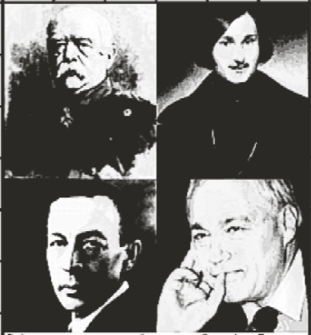
Рейхсканцлер германской империи Отто фон Бисмарк, писатель Николай Гоголь, композитор Сергей Рахманинов, телеведущий Владимир Познер - все эти, безусловно, нелюбимые люди, можно сказать о рождении имели нечто общее.