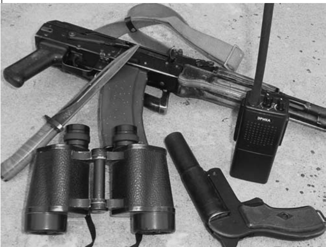
Фото и текст Виктора ЩЕРБАКОВА.

Под общим заголовком «Южная граница» мы и далее будем знакомить наших читателей о делах, буднях и беспокойной службе брединских пограничников. А пока предлагаем вашему вниманию небольшую фотозарисовку о буднях погранзащиты «Андреевская».